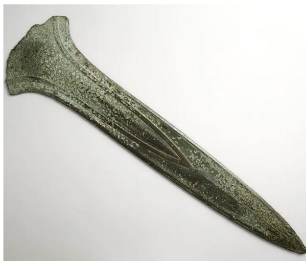
Épée de Plougrescant, exposée au musée d'archéologie nationale de Saint-Germain-en-Laye