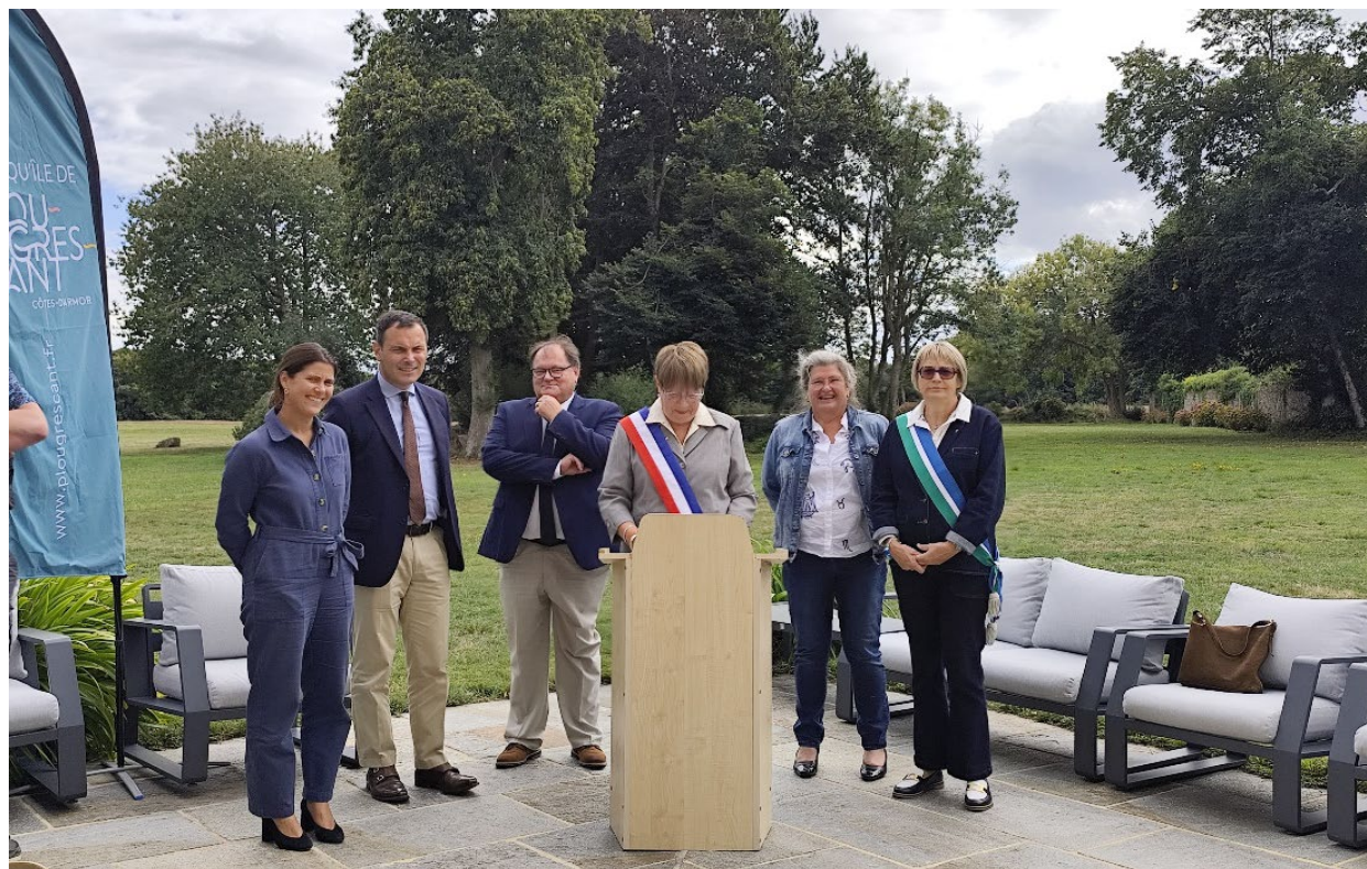
Cérémonie de remise du label par le Préfet des Côtes-d'Armor, le 9 septembre 2025 au Manoir de Kergrec'h, en présence de la Sous-préfète de Lannion, du Président de Lannion-Trégor Communauté, de la Présidente de l'Office de tourisme et de la Conseillère départementale.