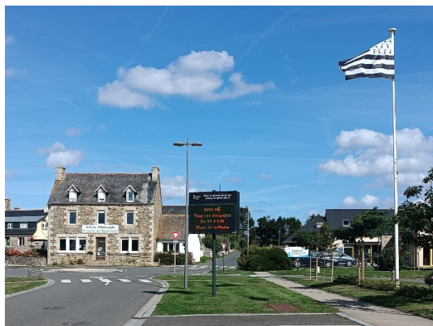
La Galerie municipale

Les personnes intéressées peuvent retirer le formulaire d'inscription auprès de la mairie et obtenir tous les renseignements nécessaires.