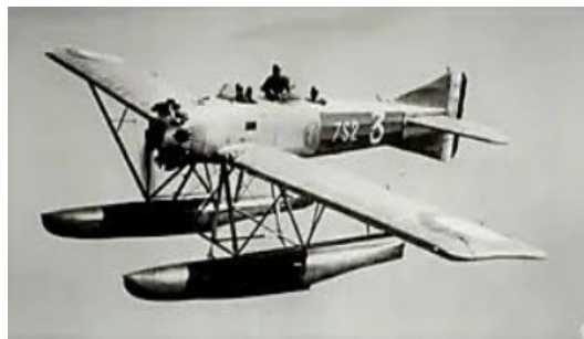
Exemple du Gourdou-Leseurre 812, hydravion de la fin des années 1930, collection particulière

L'invasion de la Pologne par l'Allemagne, le premier septembre 1939, marque le début de la seconde guerre mondiale. La France et la Grande-Bretagne, pour honorer leur promesse de garantir les frontières de la Pologne, déclarent la guerre à l'Allemagne le 3 septembre.