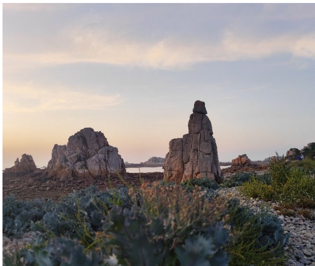
Rocher Napoléon

C'est cette richesse que nous avons à cœur de montrer, non pas dans un travail de mémoire mais dans une volonté de transmission, d'éducation et d'éveil de la curiosité de nos concitoyens comme des personnes de passage. Alors n'hésitez pas à nous interpeler afin d'enrichir notre matière, l'« Histoire/Géographie Plougrescantaise ».