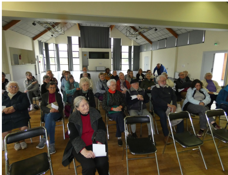
Réunion publique de présentation de Solitregor

Ce service fondé sur la bienveillance et la disponibilité, intervient uniquement lorsque aucune solution de transport professionnel n'est possible, afin de respecter pleinement l'activité des taxis et des services existants. L'objectif est simple : permettre à chacun de rester autonome et connecté à la vie locale.