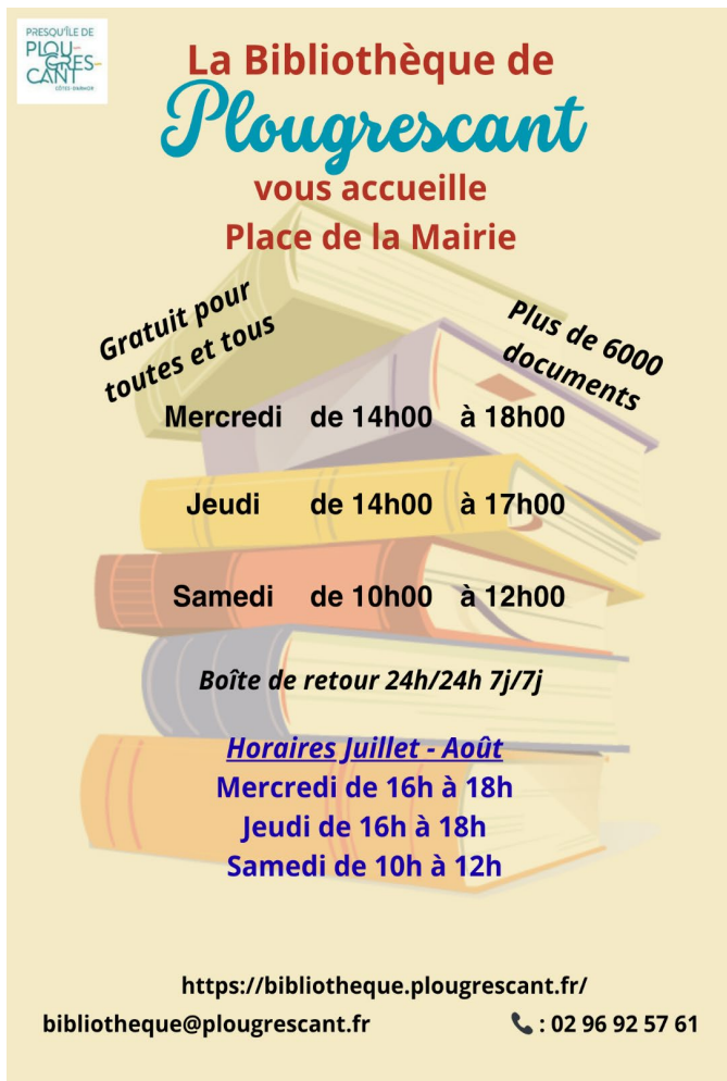
Illustration : Sophie PERROT, agent administratif

Née de l'élan d'une équipe de bénévoles, la bibliothèque de Plougrescant a trouvé son écrin près de la salle polyvalente, à deux pas de la mairie.