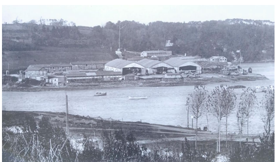
Le CAM de Plouguiel à la confluence du Jaudy et du Guindy,

Durant la première guerre mondiale de 1914-1918, les sous-marins allemands font des ravages dans les flottes alliées en coulant au total 6 394 navires marchands et une centaine de navires de guerre. Les états-majors finissent par réagir et, en 1916-1917, décident de développer la défense du littoral, en Manche et en Atlantique car stratégique pour les échanges entre l'Angleterre, la France et les Etats-Unis d'Amérique. Ce trafic maritime océanique est vital pour le ravitaillement des troupes fixées dans les tranchées de nord et de l'est de la France. Avec l'entrée en guerre des Etats-Unis, le 4 avril 1917, le débarquement des troupes américaines dans les ports français de la façade ouest doit également être sécurisé. A Plougrescant, une batterie de défense contre les sous-marins est installée sur le site de Castel Meur où vient d'être bâtie la fameuse « Villa de Nina d'ASTY ».