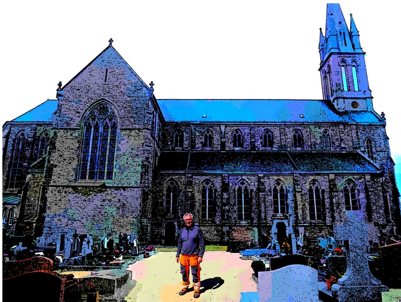
Didier Le Saint, agent des services techniques devant l'Eglise

En ce qui concerne la réfection des voiries communales nous attendons des devis pour les tronçons les plus dégradés déjà répertoriés.