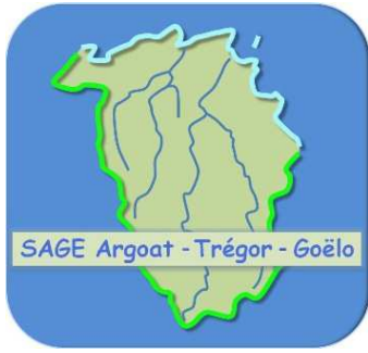
Schéma d'Aménagement et de Gestion des Eaux Argoat-Trégor-Goëlo